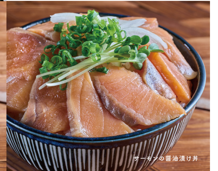
サーモンの醤油漬け丼