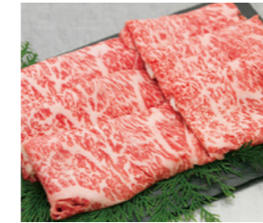
46 土佐あかうし すき焼用 [450g] 5,000円(税込)