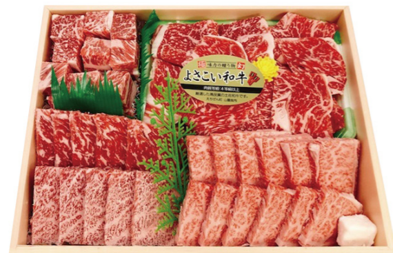
43 よさこい和牛 お肉の玉手箱 [合計840g] 12,000円(税込)