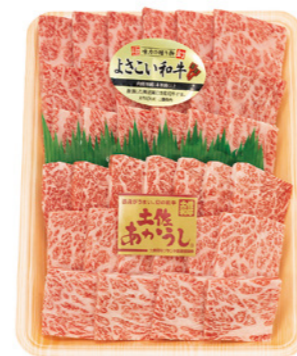
44 土佐あかうし・ よさこい和牛 焼肉食べ比べセット [合計900g] 10,000円(税込)