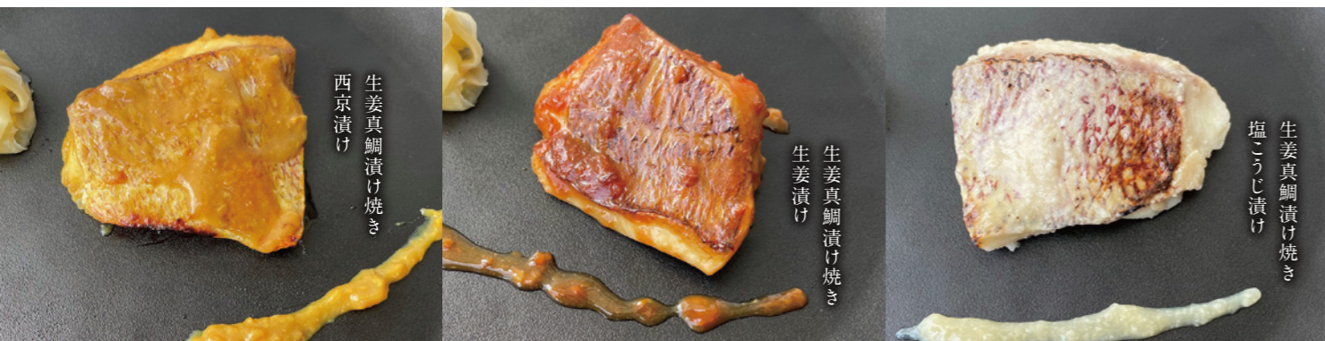
生姜真鯛漬け焼き 西京漬け