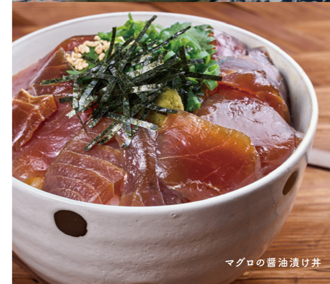
マグロの醤油漬け丼