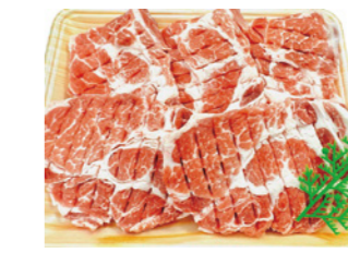
49 四国美鮮豚 肩ロースステーキ [100g×5枚] 2,500円(税込)