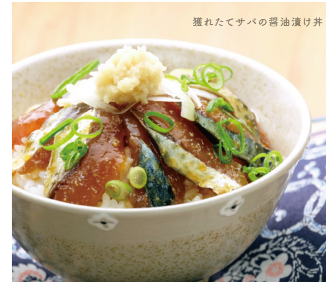
獲れたてサバの醤油漬け丼

炊き立てご飯にかけるだけ！ 鮮度抜群の絶品漬け丼を 5分程度の流水解凍で すぐお召し上がりいただけます。