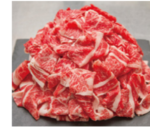
47 土佐和牛切り落とし すき焼・炒め物用 [400g] 3,000円(税込)