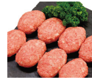
48 山重食肉手作り 黒毛和牛ハンバーグ [8個] 2,800円(税込)