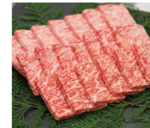
45 土佐あかうし 焼肉用 [450g] 5,000円(税込)